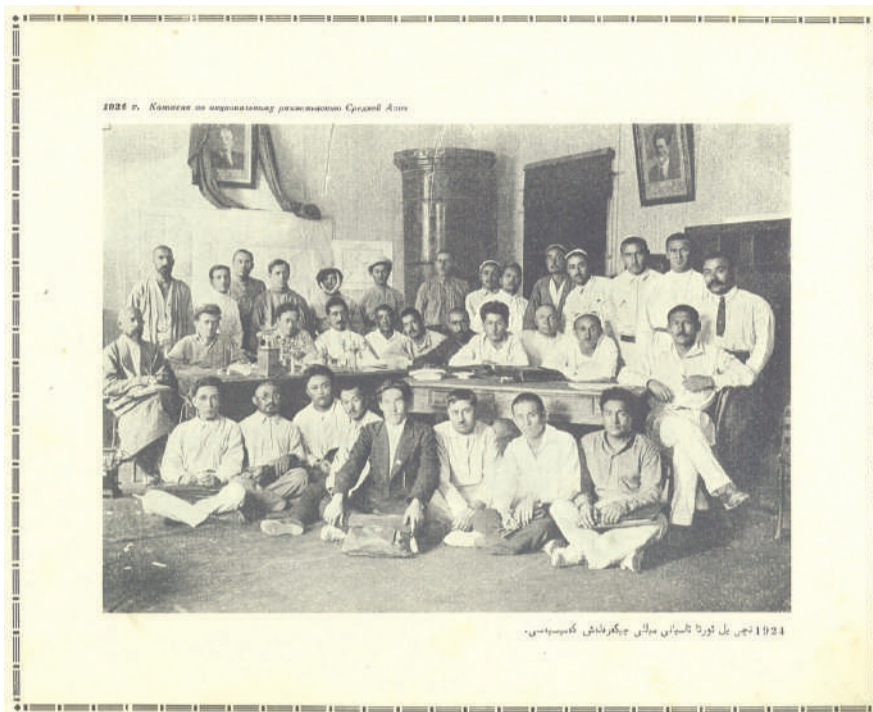
1924 жыл. Орталық Азия республикаларын ұлттық межелеу жөніндегі комиссия. Оң жақтан санағанда орындықта бірінші отырған Сұлтанбек Қожанұлы

— 1925 жылы 15-19 сәуір күндері Ақмешіт қаласында Қазақстан кеңестерінің V құрылтайы өтті. Бұл бүкіл Қазақ жерлері біріктірілгеннен кейінгі өткізілген тұңғыш Бүкілқазақтық құрылтай еді. Жалпы, сәуір құрылтайы туралы сөз қозғағанда қоғам және мемлекет қайраткері Сұлтанбек Қожанұлының еңбегін ерекше атап өтеміз. Оның өзіндік себептері де бар. Өйткені Сұлтанбек Қожанұлының ұлт мүддесі жолындағы бұған дейінгі күресінің бүкіл болмысы ұлттық республика құру, бөлшектенген Қазақ жерінің біртұтастығын қалпына келтіру, ұлт мектебін құру, Қазақстанда мемлекет тілін Қазақ тілі ету жолындағы күресінен көрініс тапса, бүкіл Қазақ жерін біріктіру ісі аяқталғаннан кейінгі жауапты қызметінде Қазақ Рес-